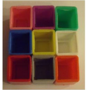
Vue du dessous

A quelle place est arrivé le coureur qui monte sur la dernière marche ? Pour construire ce « podium escalier », combien de cubes dois-tu utiliser ?