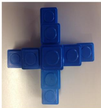
Vue du dessus

Construis le podium en t'aidant des deux photos. Combien faut-il de cubes pour le réaliser ?