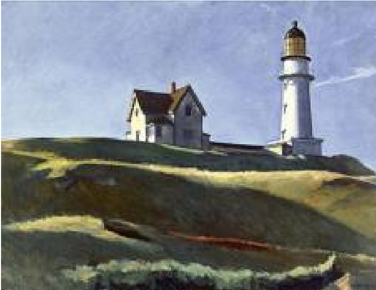
Edward Hopper, Collina del faro , 1927