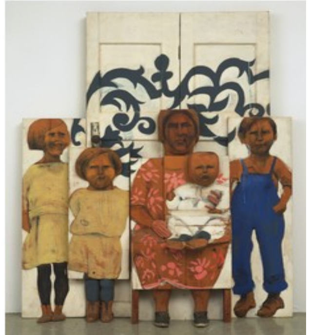
Marisol, La famiglia , 1963