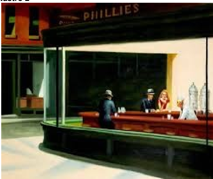
Edward Hopper, Nighthawks , 1942