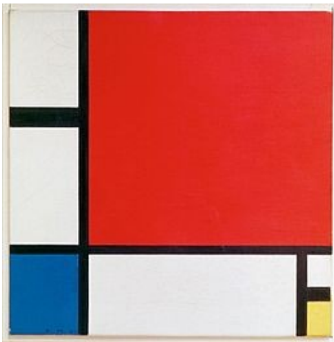
Mondrian, Composizione in rosso blu e giallo , 1930