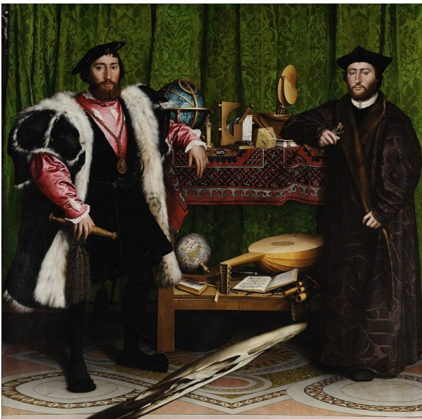
Hans Holbein il Giovane, Gli ambasciatori , 1533