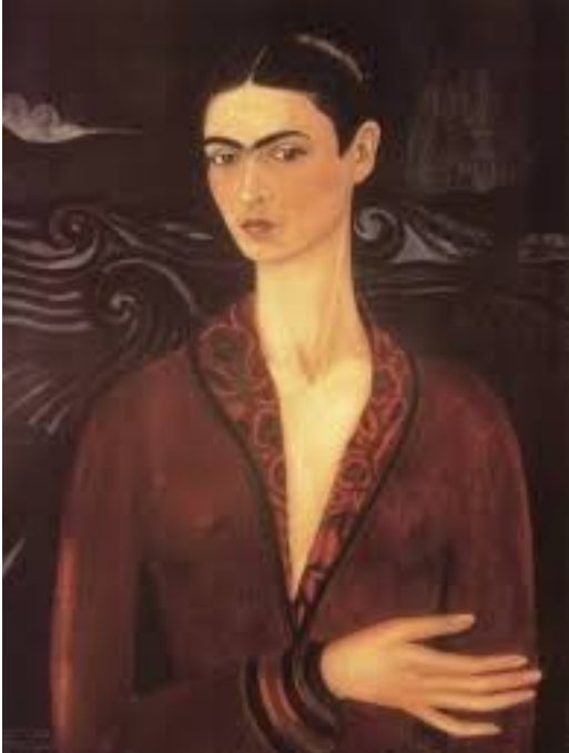
Frida Kahlo, Self-portrait wearing a velvet dress , 1926