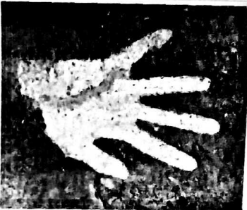
Une empreinte de main dans une grotte en Australie.

L'archéologue, lui, examine attentivement les empreintes laissées par les hommes préhistoriques, dans des grottes par exemple. « Qui étaient ces hommes qui vivaient ici avant nous ? Que peuvent nous apprendre leurs empreintes sur leur mode de vie ? » sont les questions auxquelles il essaie de répondre.