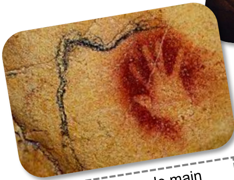
Empreinte de main