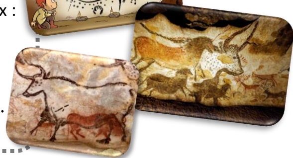
La grotte de Lascaux